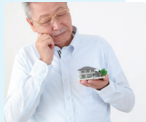
※法務専門家:司法書士、弁護士

例えば、自分の老後や介護等に必要な資金の管理や生活費給付を行う際、所有する不動産や預貯金などを信頼できる家族(ご本人が選ぶ)に託し、財産の管理・処分(不動産の売却・活用等)を家族で行う財産管理のことです。ご本人の意思能力がしっかりされている時から始められるために認知症や脳梗塞などで本人の判断能力が低下または欠く前に個人の事前対策として誰にでも利用ができる仕組みです。