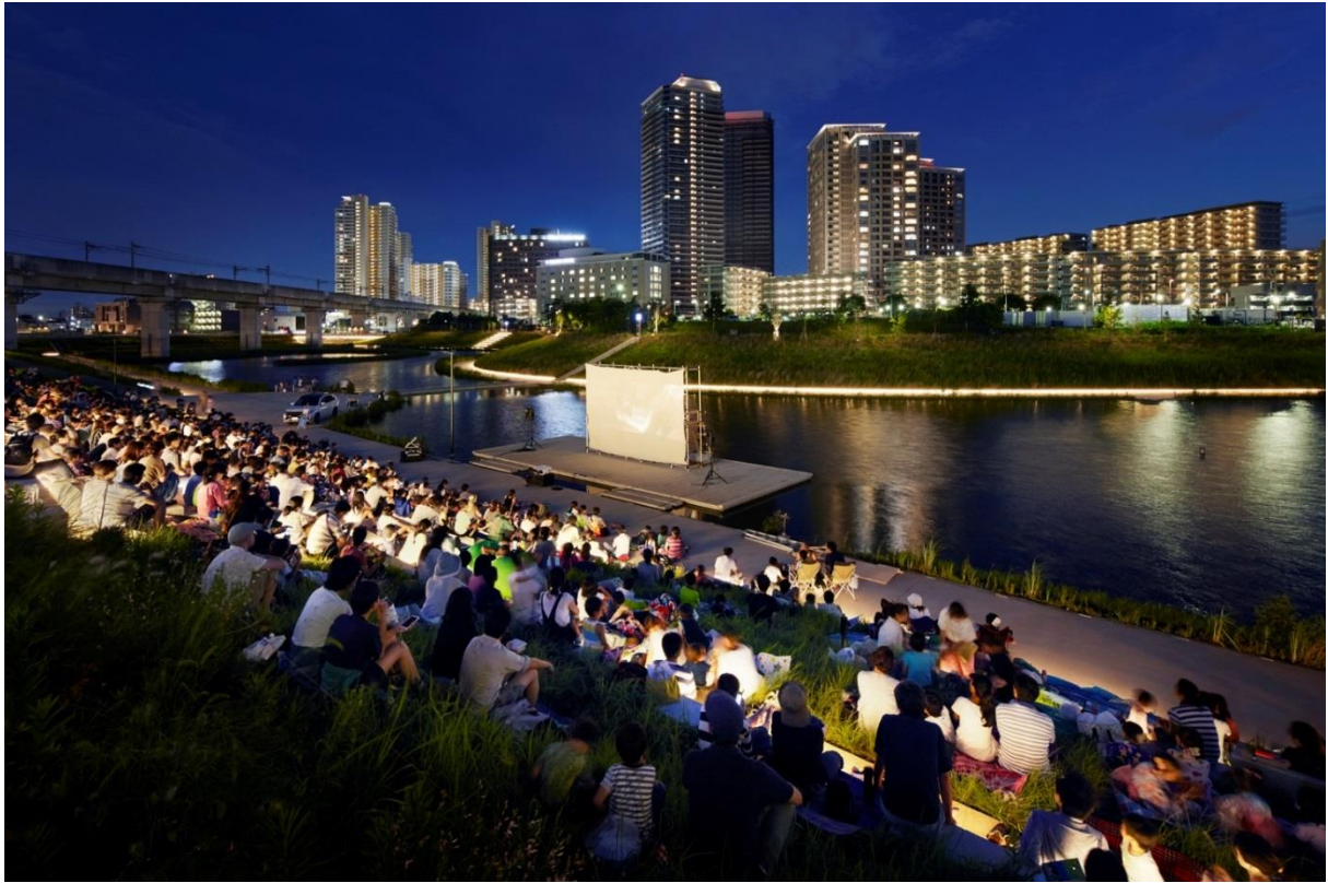
アクアテラスを利用したイベントの様子